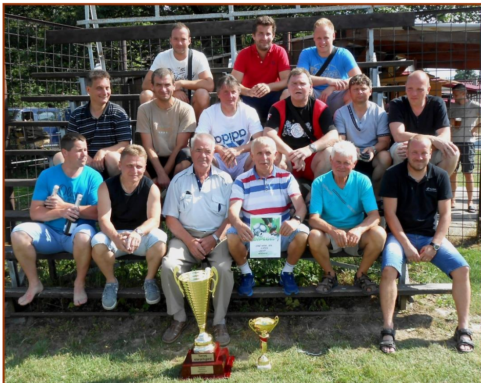
STARÁ GARDA FC LIBHOŠŤ 2016 - Vítěz turnaje "čtyřky" ve Větrkovicích